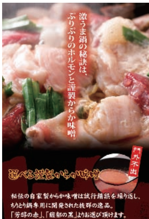
※イメージは 2 人前です

今後もカメダコーポレーショングループではお客様を元気にする商品、サービス、雰囲気、スタッフの笑顔をご提供してまいります。