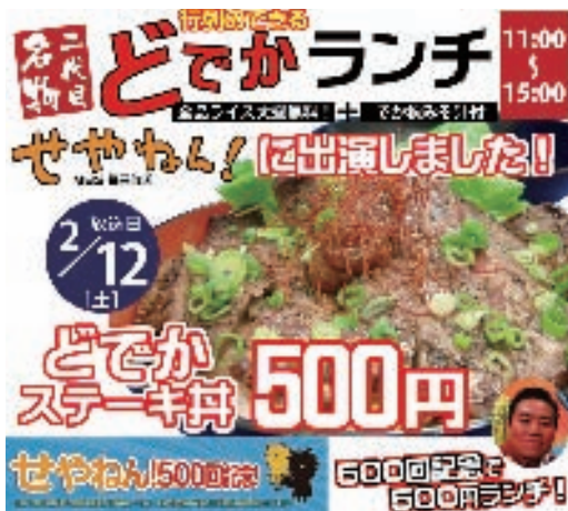
*どでかステーキ丼のイメージ

肉好きにはたまらない『ローストビーフ』も『ステーキ』も食べ放題という嬉しい演出をさせていただきます。