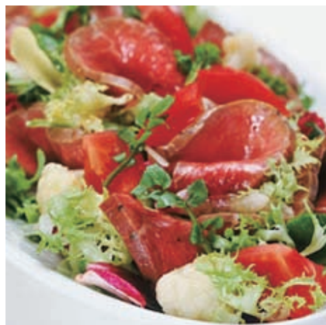
*ローストビーフサラダのイメージ